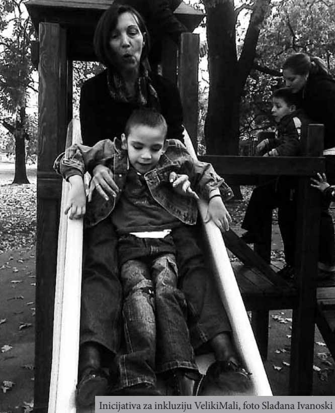
Inicijativa za inkluziju VelikiMali

praćenje i po potrebi revidiranje postavljenih ciljeva i aktivnosti. U proces planiranja i realizacije individualnog plana podrške uključeni su roditelji. Proces saradnje sa roditeljima tekao je kroz individualne susrete i timske sastanke.