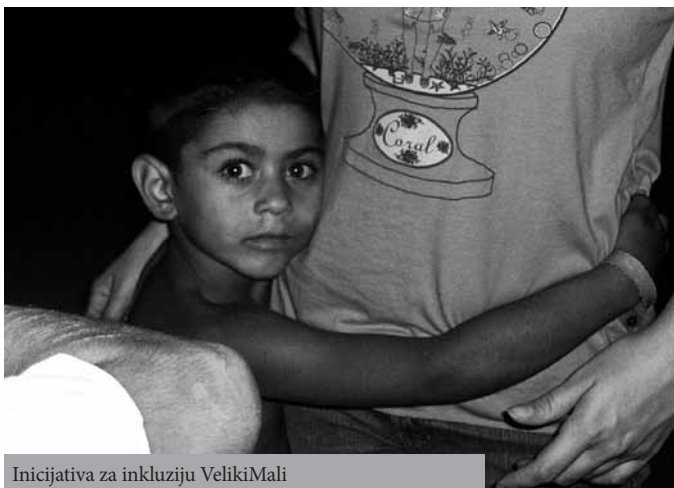
Inicijativa za inkluziju VelikiMali

Osim Konvencije o pravima deteta, postoji još čitav niz međunarodnih ugovora, kao i nacionalnih zakona kojima se regliši pravo na obrazovanje, unapređenje položaja dece iz osetljivih grupa, zabrana diskriminacije i slično. Neki od najvažnijih dokumentata su Konvencija o pravima osoba sa invaliditetom, Konvencija o zabrani diskriminacije u obrazovanju, Ustav Republike Srbije, Zakon o zabrani diskriminacije, Zakon o sprečavanju diskriminacije osoba sa invaliditetom, Zakon o osnovama sistema vaspitanja i obrazovanja i Zakon o predškolskom vaspitanju i obrazovanju.