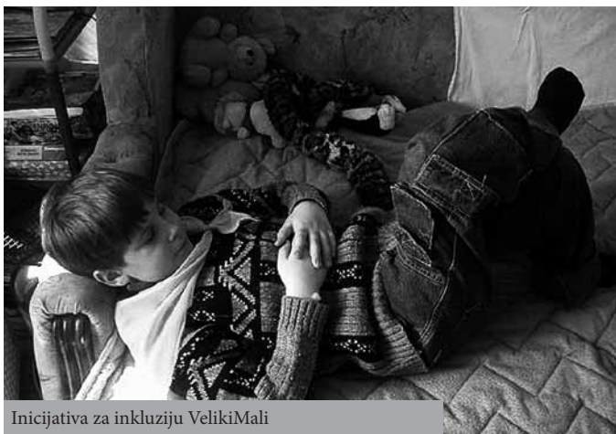
Inicijativa za inkluziju VelikiMali

Važnih promena ima i u pogledu upisa deteta u školu 20 . Škola je dužna da upiše svako dete sa područja škole. Škola može da upiše i dete sa drugog područja, na zahtev roditelja, a u skladu sa mogućnostima škole. Jedinica lokalne samouprave (opština, grad)