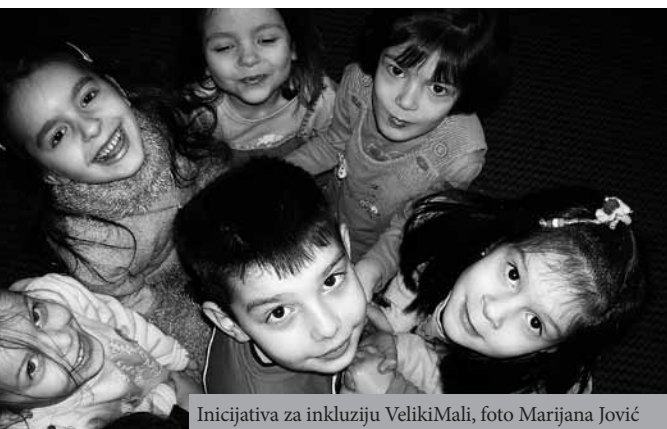
Inicijativa za inkluziju VelikiMali, foto Marijana Jović

Reč inkluzija znači „uključivanje“ i koristi se, u širem smislu, da označi procese demokratizacije jednog društva, prepoznavanje i pružanje podrške grupama koje su na bilo koji način marginalizovane. U užem smislu, ovaj termin označava promene u obrazovanju, a u upotrebu je ušao pojavom koncepta „kvalitetnog obrazovanja za sve“ 14