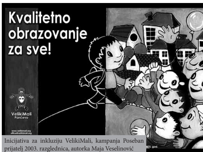
Inicijativa za inkluziju VelikiMali, kampanja Poseban prijatelj 2003. razglednica, autorka Maja Veselinović