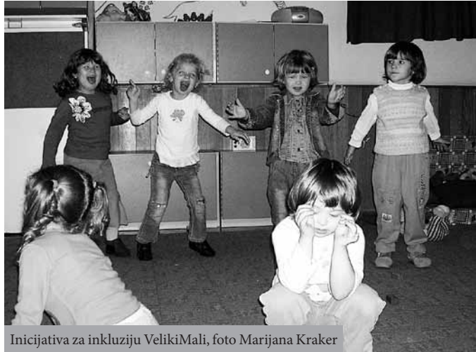
Inicijativa za inkluziju VelikiMali

Nakon prvog polugodišta pohađanja specijalne škole majka nas je zvala i iskazala nezadovoljstvo obrazovanjem u specijalnoj školi – ne postoji stalan raspored časova/aktivnosti, ne postoji mogućnost prilagođavanja školskog programa i podrške potrebama njenog sina.