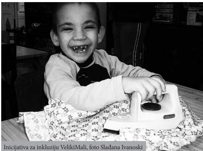
Inicijativa za inkluziju VelikiMali