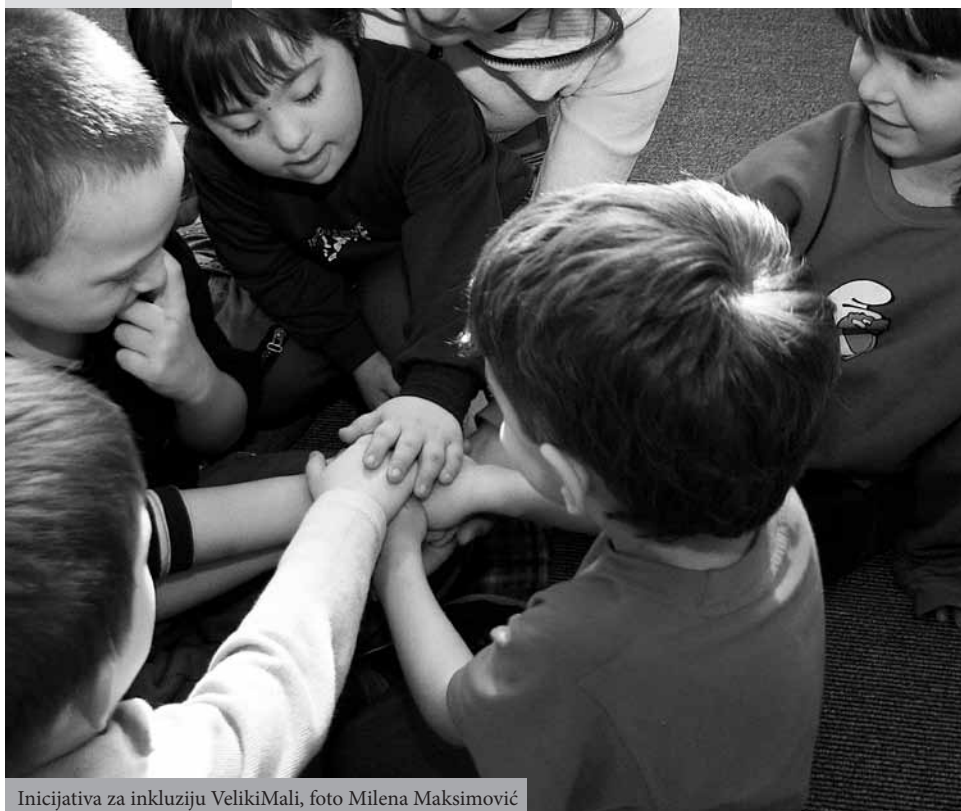
Inicijativa za inkluziju VelikiMali