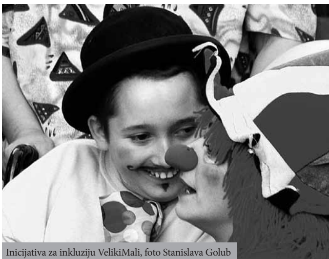
Inicijativa za inkluziju VelikiMali

P rava deteta su relativno novi pojam u većini zemalja. Dugo se smatralo da deca nemaju nikakva posebna prava, a takođe i da su roditelji, odnosno, osobe koje o detetu brinu jedini koji imaju pravo da odlučuju u ime deteta. Iako postoje i sistemske i individualne razlike, slobodno možemo da kažemo da su deca dugo posmatrana kao „vlasništvo“ svojih roditelja, a ne kao ljudska bića sa sopstvenim pravima i potrebama. Prvi međunarodni dokument koji se posebno i isključivo bavi pravima dece je Konvencija o pravima deteta. 4 Naša zemlja 5 je ratifikovala Konvenciju 1990. godine čime je preuzela obavezu da uskladi domaće zakonodavstvo sa načelima i pravima sadržanim u Konvenciji. Ovim dokumentom se potvrđuje da je deci, usled njihove osetljivosti, potrebna posebna briga i zaštita. Detetom se smatra svaka osoba ispod 18 godina.