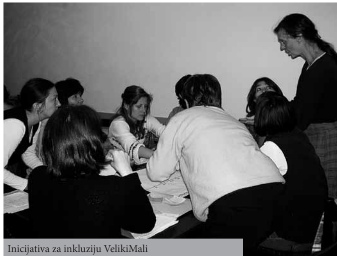
Inicijativa za inkluziju VelikiMali

Ova vrsta aktivnosti podrazumeva upoznavanje sa novim porodicama, odnosno decom, procenu i praćenje razvoja i funkcionisanja dece, informisanje i konsultacije sa roditeljima u vezi razvojnih teškoća deteta i specifičnosti u funkcionisanju i razvoju deteta, planiranje individualnog plana podrške za dete, konsultacije i savetodavni rad sa roditeljima u vezi pristupa i strategija u cilju podsticanja razvoja kao i informisanje roditelja u vezi prava dece sa teškoćama u razvoju, načinima realizacije i pružanju podrške u realizaciji prava.