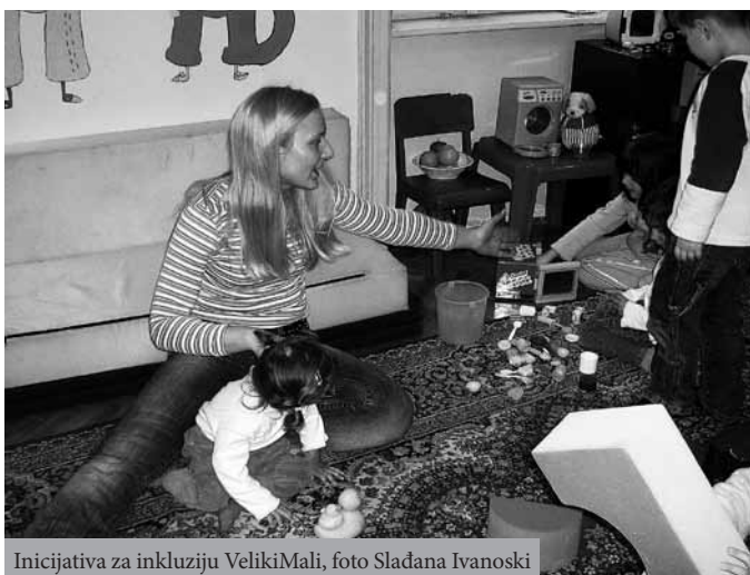
Inicijativa za inkluziju VelikiMali

U cilju kvalitetnijeg rada integrativne grupe i pružanja individualizovane podrške deci kreirani su individualni planovi podrške za decu. Proces kreiranja individualnog plana podrške počinje od detaljnog opisa deteta (načina funkcionisanja, interesovanja, mogućnosti, specifičnosti u razvoju i sl.). U odnosu na to, planirani su specifični vaspitno-obrazovni ciljevi za dete, kao i načini (aktivnosti) njihovog dostizanja. Proces individualizacije programa podrške je veoma dinamičan, jer zahteva svakodnevno