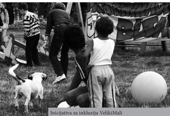
Inicijativa za inkluziju VelikiMali